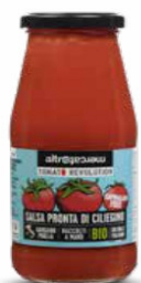
SALSA PRONTA DI CILIEGINO BIO - 410 GR