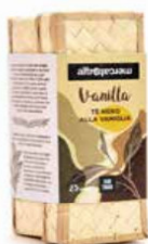
TÈ NERO ALLA VANIGLIA IN CESTINO 25 FILTRI - 37,5 GR