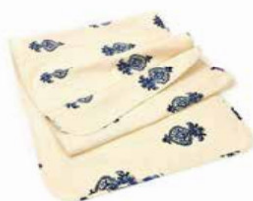
RUNNER IN COTONE 10 Euro + iva 40002319