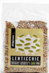
LENTICCHIE ESSICcate BIO - 500 GR