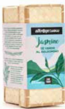
TÈ VERDE AL GELSOMINO IN CESTINO 25 FILTRI - 37,5 GR