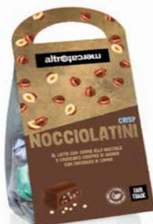
NOCCIOLATINI CRISP CIOCCOLATINI AL LATTE RIPIENI ALLA NOCCIOLA 120 GR