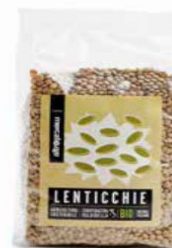
LENTICCHIE ESSICcate BIO 500 GR