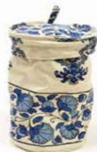
GESTINO DA APPENDERE IN COTONE 5 Euro + iva 40002309