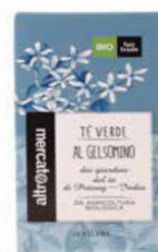
TÈ VERDE AL GELSOMINO 20 FILTRI BIO - 40 GR