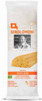
LINGUINE PASTA DI SEMOLA GIROLOMONI BIO - 500 GR

Tutti i prodotti di questa proposta sono MADE IN ITALY