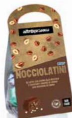
NOCCIOLATINI CRISP RIPIENI ALLA NOCCIOLA 120 GR