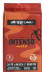
MISCELA INTENSA MACINATO PER MOKA 250 GR