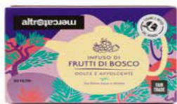
INFUSO FRUTTI DI BOSCO 20 BUSTINE - 40 GR