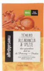
TÈ NERO ALL'ARANCIA E SPEZIE 20 FILTRI BIO - 40 GR