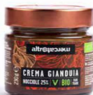
CREMA GIANDUIA BIO - 230G