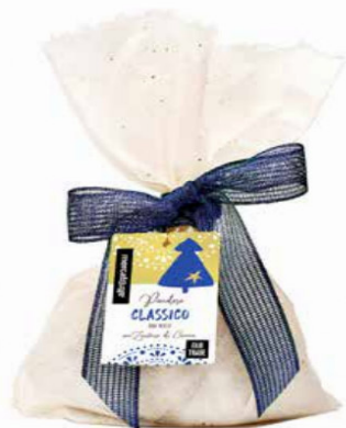
PANDORO CLASSICO CON ZUCCHERO A VELO DI CANNA 700 GR