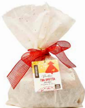
PANETTONE CON UVETTA SENZA CANDITI 700 GR