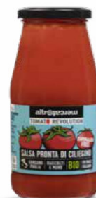
SALSA PRONTA DI CILIEGINO BIO - 410 GR