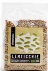
LENTICCHIE ESSICcate BIO - 500 GR