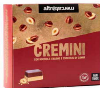
CREMINI CIOCCOLATINI BIGUSTO ALLA NOCCIOLA 250 GR