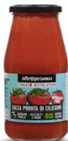
SALSA PRONTA DI CILIEGINO BIO - 410 GR