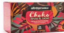
CHOKO - INFUSO CACAO AI FRUTTI DI BOSCO 20 FILTRI - 40 GR