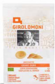
ORECCHIETTE PASTA DI SEMOLA GIROLOMONI BIO - 500 GR