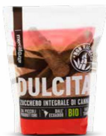
MASCOBADO ZUCCHERO INTEGRALE DI CANNA BIO - 500 GR