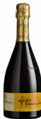
VINO MOSCATO DOGG FIORI D'ARANCIO BIO - 750 ML