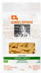
MACCHERONI DI GRANO DURO CAPPELLI GIROLOMONI BIO - 500 GR