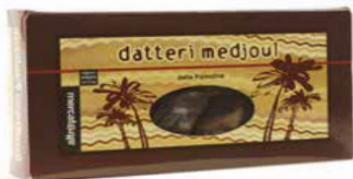
DATTERI MEDJOUL AL NATURALE PALESTINA 200 GR