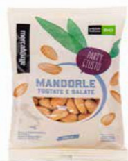
MANDORLE TOSTATE E SALATE BIO - 100 GR