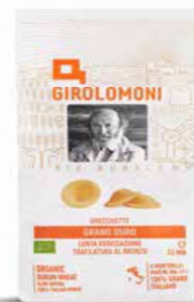
ORECCHIETTE PASTA DI SEMOLA GIROLOMONI BIO - 500 GR