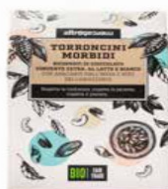
TORRONCINI RICOPERTI BIO - 180 GR