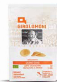
ORECCHIETTE PASTA DI SEMOLA GIROLOMONI BIO - 500 GR