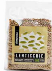
LENTICCHIE ESSICcate BIO 500 GR