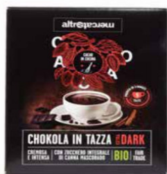
CHOKOLA - EXTRA DARK CIOCCOLATA IN TAZZA BIO 125 GR