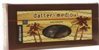
DATTERI MEDJOL AL NATURALE PALESTINA 200 GR