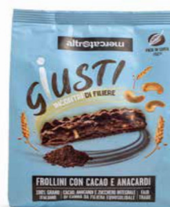
BISCOTTI CON CACAO E ANACARDI 300 GR