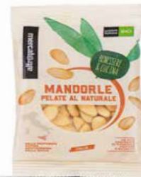
MANDORLE PELATE DI SICILIA BIO - 100 GR