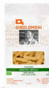
MACCHERONI DI GRANO DURO CAPPELLI GIROLOMONI BIO - 500 GR