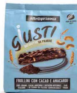
BISCOTTI CON CACAO E ANACARDI 300 GR