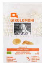
ORECCHIETTE PASTA DI SEMOLA GIROLOMONI BIO - 500 GR