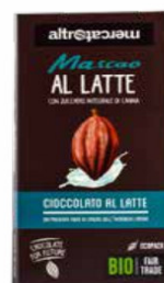
MASCAO CIOCCOLATO AL LATTE BIO - 100 GR