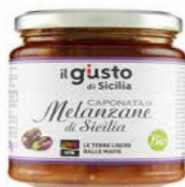
CAPONATA DI MELANZANE LIBERA TERRA BIO - 270 GR