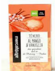
TÈ NERO AL MANGO E VANIGLIA 20 FILTRI BIO - 40 GR