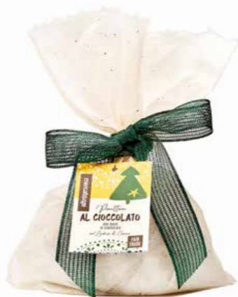
PANETTONE AL CIOCCOLATO CON GOCCE DI CIOCCOLATO 700 GR