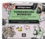
TORRONCINI MORBIDI PISTACCHIO E ANACARDI 120 GR