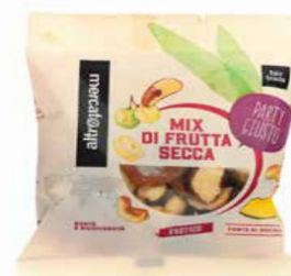
MIX DI FRUTTA SECCA ASSORTITA 100 GR