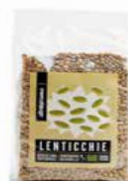
LENTICCHIE ESSICcate BIO 500 GR