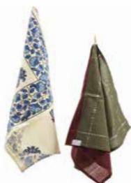
STROFINACCIO IN COTONE 2,5 Euro + iva 40002312

Ogni lavorato è un pezzo unico , caratterizzato da trame e colori differenti l'uno dall'altro che rendono eccezionalmente originale questa collezione. I tessuti nelle foto sono solo un esempio indicativo, trattandosi di materiali di riciclo non è possibile scegliere la fantasia, fatti sorprendere!