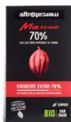
MASCAO CIOCCOLATO FONDENTE EXTRA 70% BIO - 100 GR