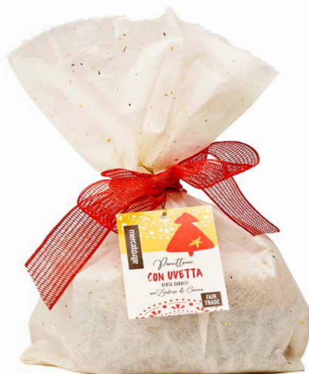
PANETTONE CON UVETTA SENZA CANDITI 700 GR