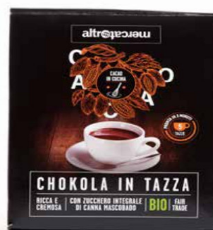
CHOKOLA CIOCCOLATA IN TAZZA BIO 125 GR