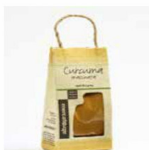
CURCUMA MACINATA 20 GR