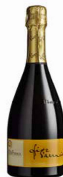
VINO MOSCATO DOCG FIORI D'ARANCIO BIO - 750 ML