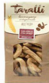
TARALLI ALL'OLIO EXTRAVERGINE D'OLIVA 250 GR