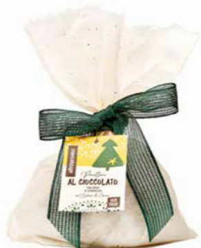
PANETTONE AL CIOCCOLATO CON GOCCE DI CIOCCOLATO 700 GR