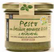
PESTO DI BASILICO DOP E ANACARDI 130 GR