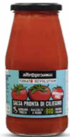
SALSA PRONTA DI CILIEGINO BIO - 410 GR