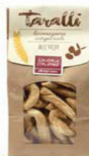
TARALLI ALL'OLIO EXTRAVERGINE D'OLIVA 250 GR