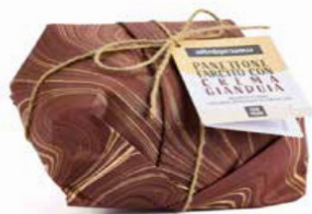
PANETTONE FARCITO CON CREMA GIANDUIA 750 GR