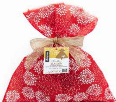
PANETTONE GLASSATO CON GOCCE DI CIOCCOLATO E UVETTA 750 GR