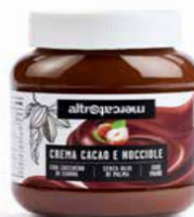
CREMA AL CACAO E NOCCIOLE 400 GR