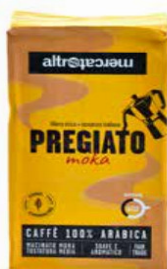
PREGIATO MOKA CAFFÈ 100% ARABICA 250 GR