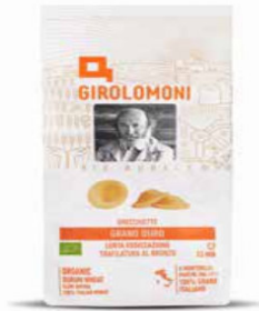
ORECCHIETTE PASTA DI SEMOLA GIROLOMONI BIO - 500 GR