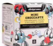
CROCCANTI DI ANACARDI MONOPORZIONE 120 GR