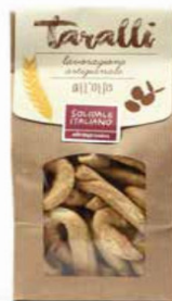
TARALLI ALL'OLIO EXTRAVERGINE D'OLIVA 250 GR