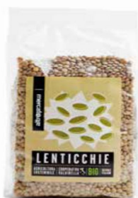
LENTICCHIE ESSICATE BIO 500 GR