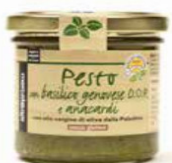
PESTO DI BASILICO DOP E ANACARDI 130 GR