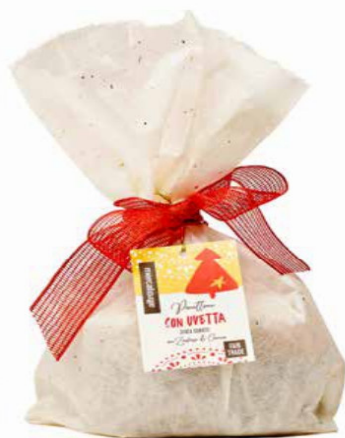
PANETTONE CON UVETTA SENZA CANDITI 700 GR