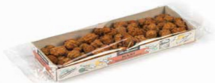
MANÌ ARACHIDI PRALINATE 100 GR