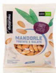
MANDORLE TOSTATE E SALATE BIO - 100 GR