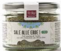
SALE ALLE ERBE DI SICILIA BIO - 95 GR