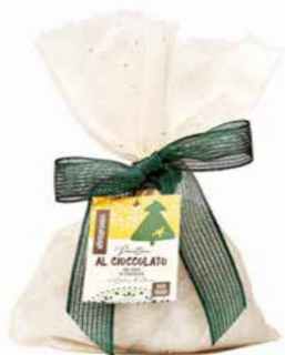
PANETTONE AL CIOCCOLATO CON GOCCE DI CIOCCOLATO 700 GR