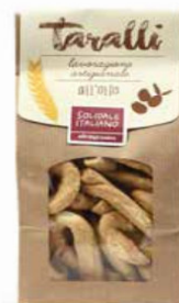
TARALLI ALL'OLIO EXTRAVERGINE D'OLIVA 250 GR