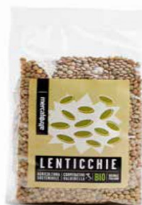
LENTICCHIE ESSICcate BIO 500 GR