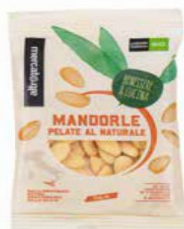
MANDORLE PELATE DI SICILIA BIO - 100 GR