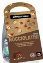
NOCCIOLATINI CRISP CIOCCOLATINI AL LATTE RIPIENI ALLA NOCCIOLA 120 GR