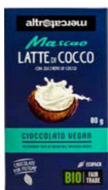
MASCAO CIOCCOLATO AL LATTE DI COCCO BIO - 80 GR