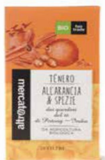
TÈ NERO ALL'ARANCIA E SPEZIE 20 FILTRI BIO - 40 GR