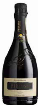
QUORUM PROSECCO SUPERIORE D.O.C.G. BIO - 750 ML