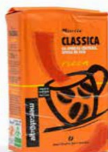
MISCELA CLASSICA MACINATO PER MOKA 250 GR