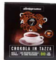
CHOKOLA CIOCCOLATA IN TAZZA BIO - 125 GR