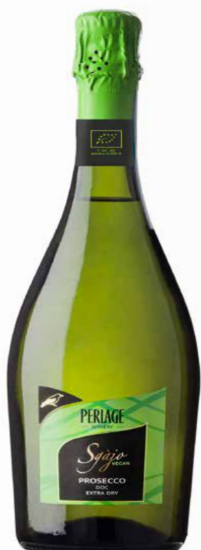
PROSECCO DOC EXTRA DRY VEGANO SGAJO BIO - 750 ML