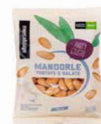
MANDORLE TOSTATE E SALATE BIO - 100 GR