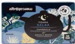
TISANA RELAX 20 BUSTINE 40 GR