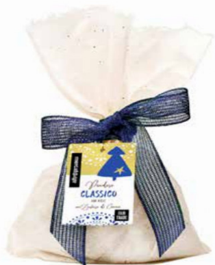
PANDORO CLASSICO CON ZUCCHERO A VELO DI CANNA 700 GR