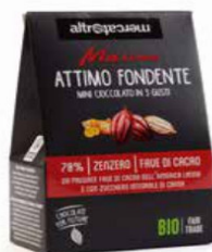
ATTIMO FONDENTE MINI CIOCCOLATO MASCAO IN 3 GUSTI BIO - 130G