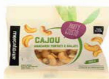
CAJOU ANACARDI TOSTATI E SALATI 50 GR