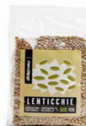
LENTICCHIE ESSICcate BIO 500 GR