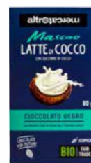
MASCAO CIOCCOLATO AL LATTE DI COCCO BIO - 80 GR