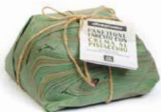
PANETTONE FARCITO CON CREMA AL PISTACCHIO 750 GR