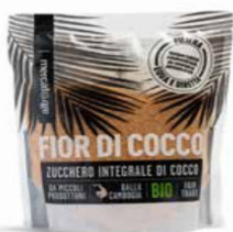
ZUCCHERO DI COCCO BIO - 250 GR