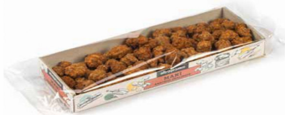
MANÌ ARACHIDI PRALINATE 100 GR