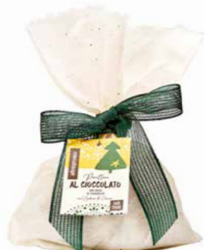
PANETTONE AL CIOCCOLATO CON GOCCE DI CIOCCOLATO 700 GR