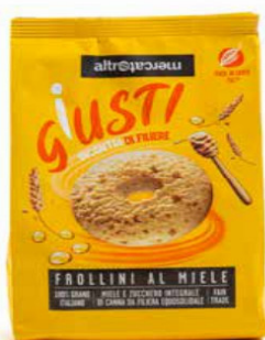
BISCOTTI AL MIELE 300 GR