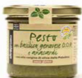
PESTO DI BASILICO DOP E ANACARDI 130 GR