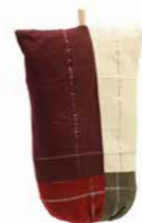
PORTA SACCHETTI APPENDIBILE IN COTONE 5 Euro + iva 40002314