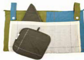
SET FORNO IN COTONE 10 Euro + iva 40002306