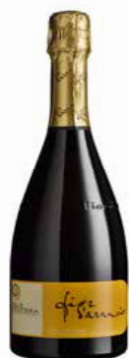
VINO MOSCATO DOGG FIORI D'ARANCIO BIO - 750 ML