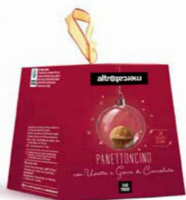
PANETTONCINO GOCCE DI CIOCCOLATO E UVETTA 100 GR